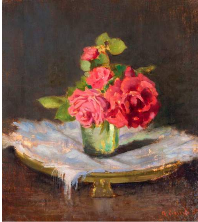
Rose 1957, olio su tavola, 33.5 x 30.5 cm