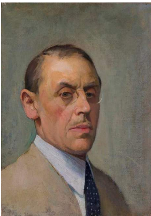
Autoritratto olio su tela, 50 x 36.5 cm