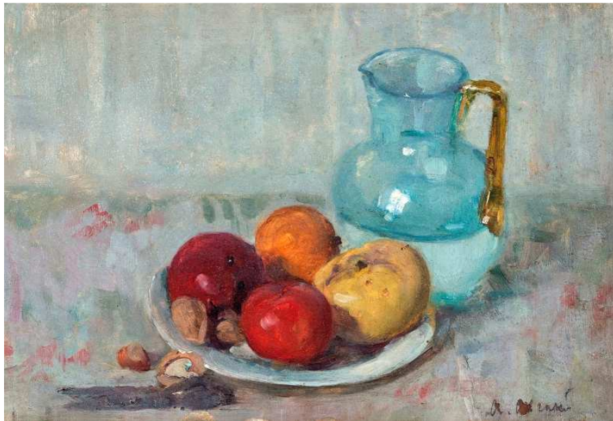
Natura morta con frutti e brocca olio su cartone, 22.5 x 15.5 cm