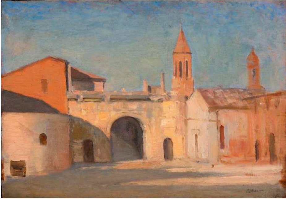
Fano olio su tavola, 23 x 33 cm