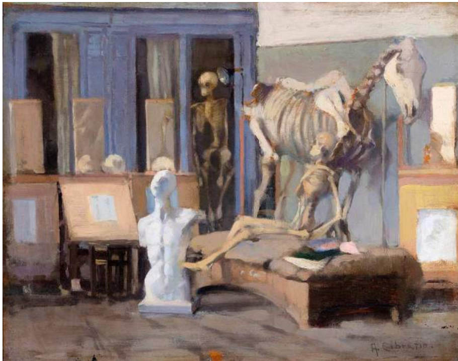
Un angolo della mia scuola all'Accademia olio su tavola, 22 x 28 cm