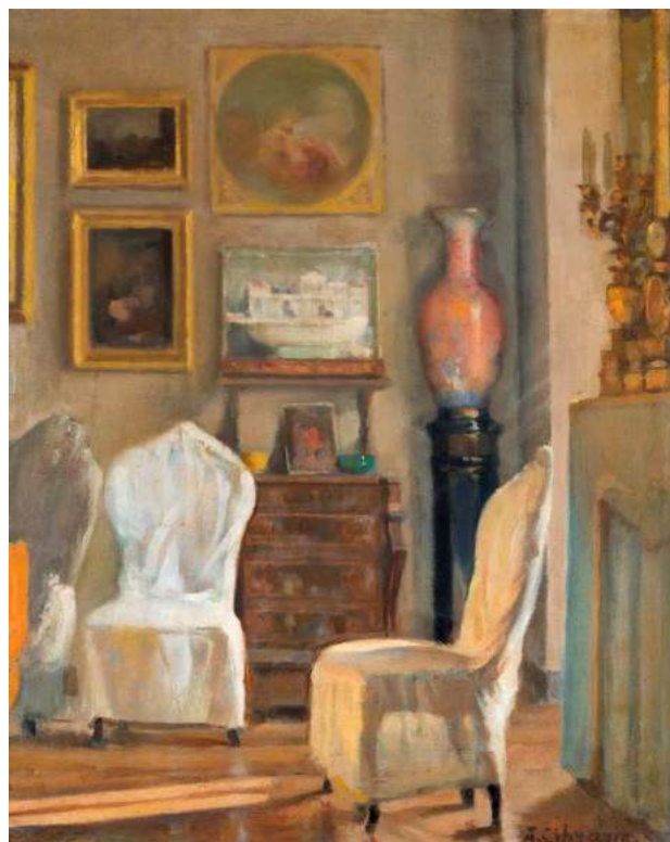
Il salotto della casa di corso Francia olio su tavola, 28 x 23 cm