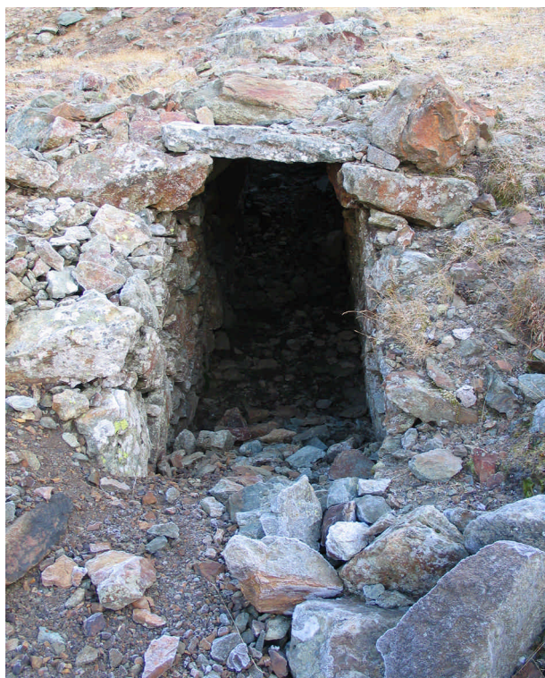
Ingresso di una galleria mineraria di Usseglio.

4) proiezione digitale di immagini sulle antiche miniere di Usseglio (partecipazione gratuita).